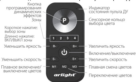
Рис.2. Управление контроллером с пульта ДУ.